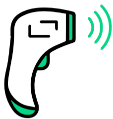
AFERIÇÃO DE TEMPERATURA

► Medir a temperatura, explicando, se necessário, o objetivo desta medida.